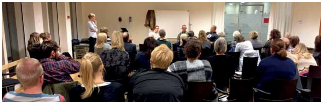
Foredrag i Sundhedscenter Viborg.