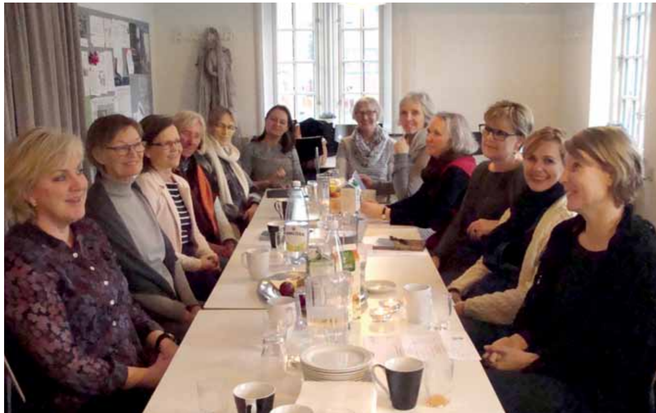
Frivillige terapeuter i Kvisten Viborg.

Uden frivillige – ingen Kvisten. I Kvisten Viborg bidrager de mange professionelle terapeuter med adskillige frivillige timer hver eneste uge. En indsats som både er gratis og af høj faglig kvalitet. Motivationen er drevet af lysten til at hjælpe og gøre en forskel for en sårbar og ofte overset gruppe mennesker.