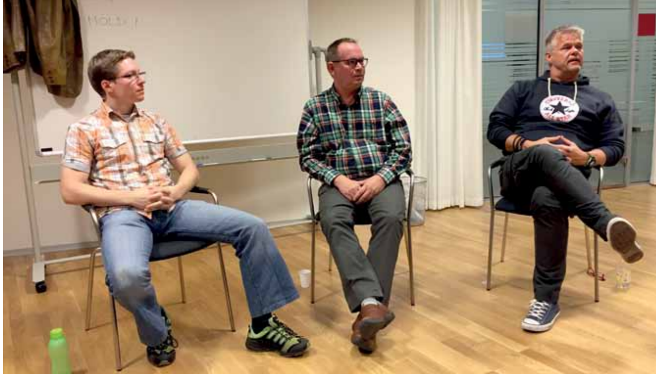
Foredrag i Sundhedscenter Viborg.